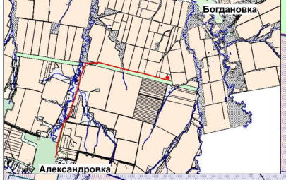
Схема согласования места размещения объекта строительства АО "Самаранефтегаз": "Эксплуатационная скважина № 77 Шильского месторождения" на территории муниципальных районов Нефтегорский, Большеглушицкий Самарской области, в границах сельских поселений Богдановка, Александровка